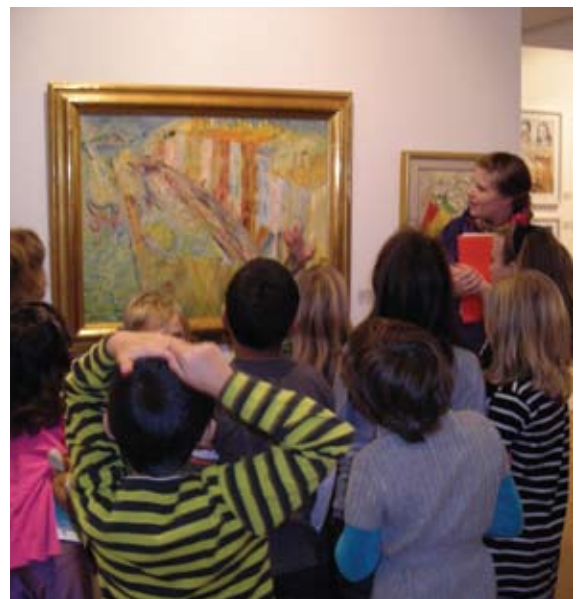
Bildjakt på Hallands Konstmuseum