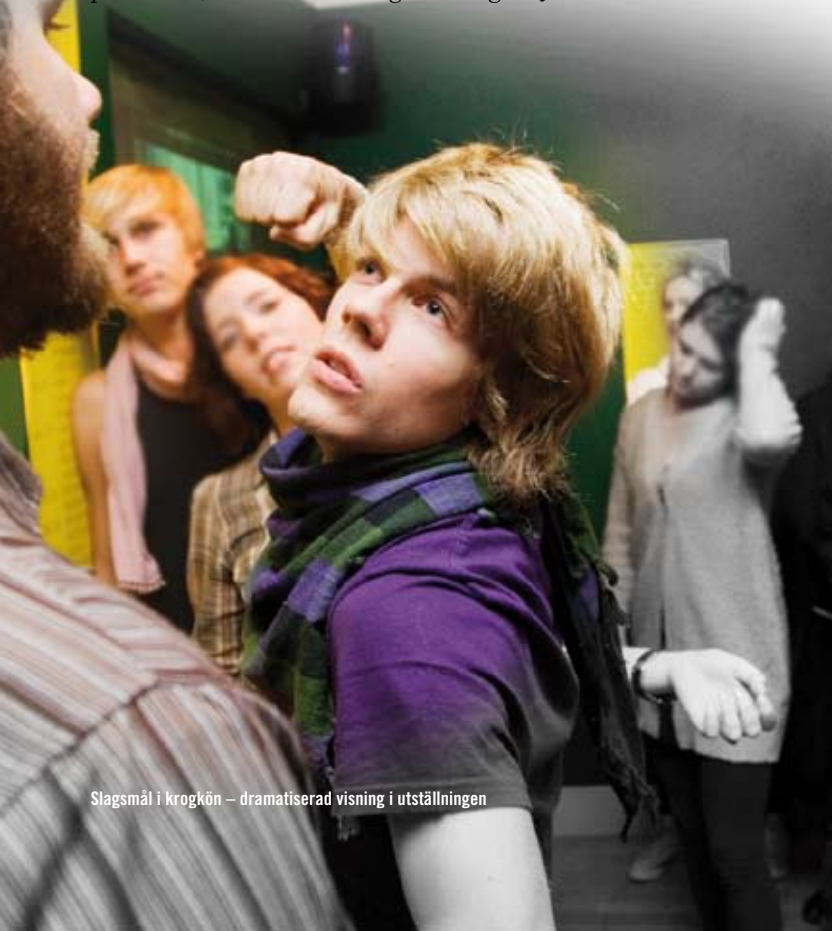
Slagsmål i krogkön – dramatiserad visning i utställningen