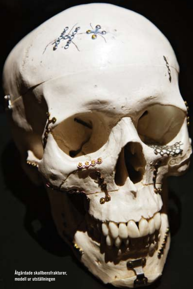
Åtgärdade skallbensfrakturer, modell ur utställningen